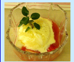
苺のスープ 蜂蜜風味のアイスクリーム添え