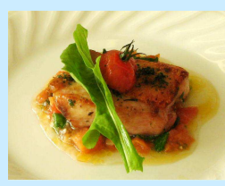
にんにくとハーブが香る桜姫鳥のロースト トマトとルッコラのマリネソース