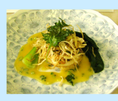
お魚とお豆腐の香味焼き お味噌風味のブルブランソース