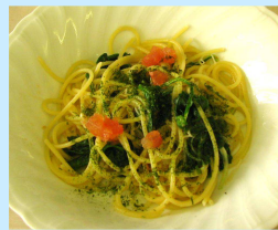
あおもり丸ごと菜園風スパゲティ